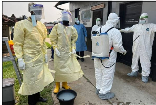
Agents de santé en équipements de protection individuelle lors d'une opération de désinfection dans la zone de santé de Bulape, pendant la riposte à l'épidémie d'Ebola.

Selon des chiffres relayés par l'organisation régionale, environ 246 cas suspects et 65 décès avaient déjà été enregistrés au 15 mai. Sur les 20 échantillons analysés, 13 se sont révélés positifs au virus Ebola, dont quatre