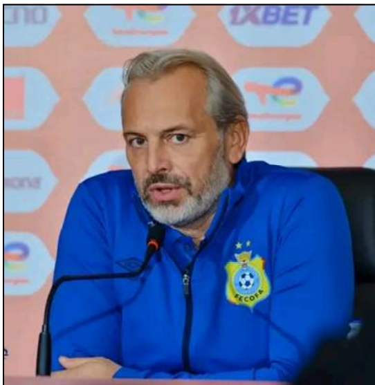
Le sélectionneur national Sébastien Desabre justifie le choix de ses 26 joueurs pour la Coupe du monde 2026.