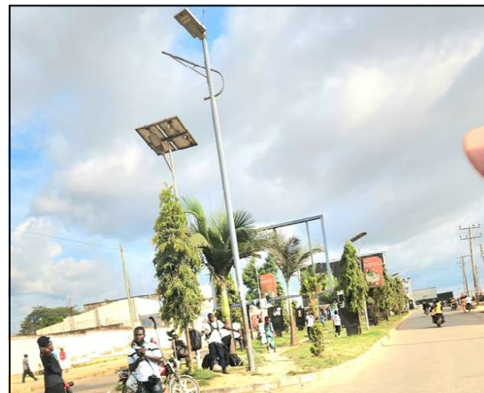
Une vue du boulevard de libération de la ville de Bunia, chef-lieu de la province de l'Ituri.

la route nationale numéro 27 (RN27) axe Bunia-Komanda. Aucun dispositif sanitaire n'est observé à ces jours sur différentes barrières de cet axe routier. Une situation qui pourrait également entraîner la propagation rapide de la maladie à virus d'Ebola dans d'autres parties de la province de l'Ituri notamment dans les territoires d'Irumu et de Mambasa ainsi que dans la province du Nord Kivu. Face à cette urgence sanitaire, la population est appelée à faire preuve de vigilance et à respecter strictement les mesures barrières afin de lutter efficacement contre cette maladie.