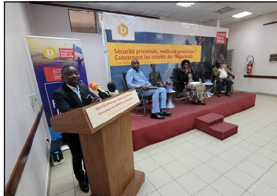
Vue des intervenants au café politique "Uongozi".