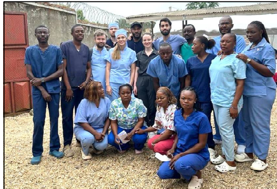
Photo de famille des médecins russes et des professionnels de santé congolais.

Le volet transfert des compétences était l'un des principaux axes de la mission. Les spécialistes russes ne se