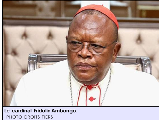
Le cardinal Fridolin Ambongo.

Le prélat a également lancé un appel direct au peuple congolais, l'invitant à se préparer à une éventuelle mobilisation populaire si des projets de lois liés à une