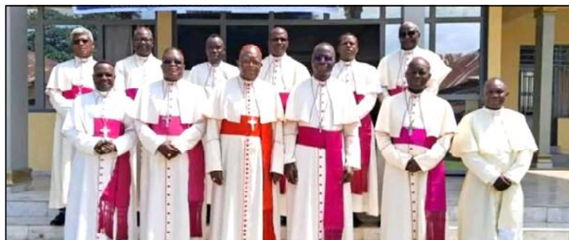
Les évêques membres de l'ASSEPKIN appellent au dialogue et au respect mutuel.

Dans leur déclaration finale, ils stigmatisent notamment les maux qui minent la société congolaise