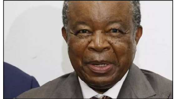
Le professeur Jean-Jacques Muyembe à l'Institut national de recherche biomédicale (INRB) à Kinshasa, le 4 mars 2023.

Pour les cas qui étaient venus de Bunia, c'était un cas qui était parti à l'enterrement de son père décédé à Bunia. Puis, quand il est revenu, quand on a commencé à parler de cette épidémie, il est venu se présenter spontanément à l'INRB pour faire le test. Mais le test est