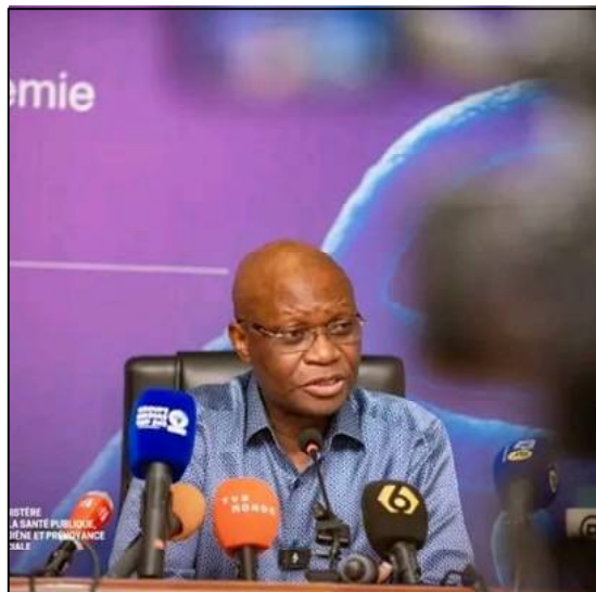
Le ministre de la Santé publique, Samuel Roger Kamba.

«Nous avons 59 malades qui sont activement pris en