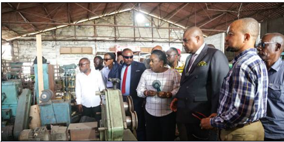
Le DGA du FPI découvre "des machines datant, pour la plupart, de plus de cinquante ans, et des ateliers vieillissants, mais encore animés par une expertise technique reconnue..."

équipements, appelés à être réhabilités dans le cadre du plan de modernisation soumis au Fonds de Promotion de l'Industrie.