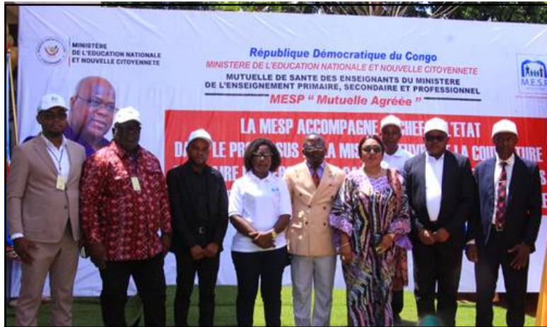
Le gouverneur a.i. du Sud-Ubangi (au centre) s'est réjoui de l'implantation de la Mutuelle de santé des enseignants dans sa province.