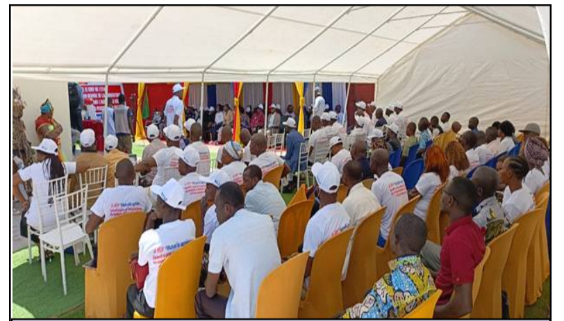
Mobilisés à Gemena, des enseignants du Sud-Ubangi ont poussé un ouf de soulagement en assistant au démarrage des activités de leur mutuelle de santé.

Aux dires de la Représentante de Mme le Secrétaire Exécutif National de la MESP, "cette avancée traduit la détermination de la Mutuelle à renforcer la protection sociale des professionnels de