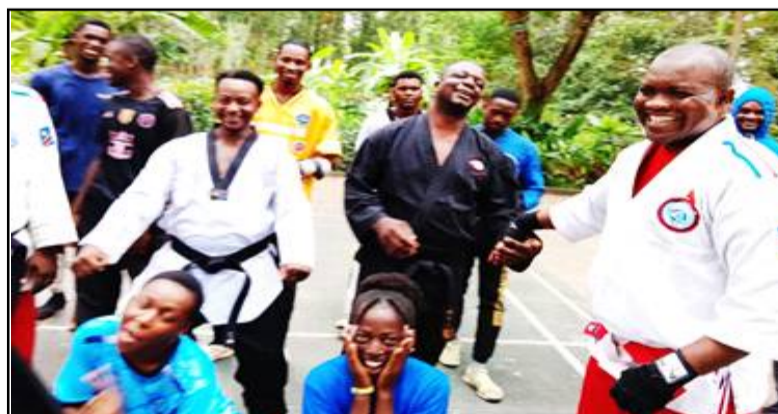
Une bonne ambiance était au rendez-vous lors du séminaire de Brazza la verte.

Le requin-do kick punch vient de franchir les frontières nationales rd congolaises et s'internationalise. La discipline sportive d'origine congolaise (RDC) a posé ses valises au Congo d'en face. Le tout premier pays en dehors de la RDC, berceau de cette discipline dont le géniteur est le Grand maître Tshibambe Mwimba dit "Me Chinois", "Grand Moine". Ce cap important que vient de passer cet art martial survient à la faveur de la formation par la Fédération congolaise de requin-do kick punch (Fecorek) de 17 instructeurs de requin-do kick punch, du vendredi 8 au dimanche 10 mai à Brazzaville, capitale de la