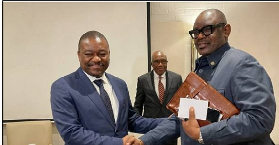
Yves Buteke, représentant de la société SMOOTH FORTUNE et le Ministre des Mines de la RDC, Louis Watum Kabamba.

Dans la capitale Rd congolaise, le représentant mandaté de la société Smooth Fortune et les investisseurs venus tâter le terrain congolais ont rencontré samedi le ministre des Mines, Louis Watum Kabamba.