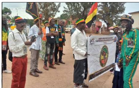
Manifestation des rastamen au Sud-Kivu. PHOTO D'ILLUSTRATION DROITS TIERS

Au cours de cette rencontre, plusieurs intervenants ont insisté sur la nécessité de renforcer la cohésion sociale dans une région marquée par des défis sécuritaires persistants. Les participants ont ainsi exprimé leur volonté de contribuer à la construction d'un climat