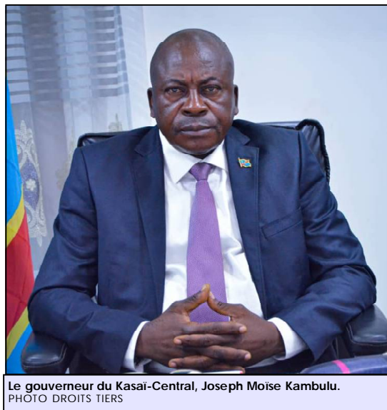
Le gouverneur du Kasaï-Central, Joseph Moïse Kambulu.

Le nouvel exécutif provincial comprend dix