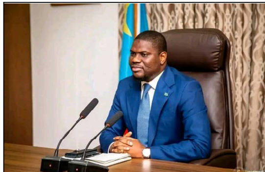
Le Gouverneur du Kongo Central, Grâce Bilolo.

Depuis janvier dernier, la justice congolaise avait sollicité l'autorisation de poursuites contre Grâce Bilolo pour des soupçons de