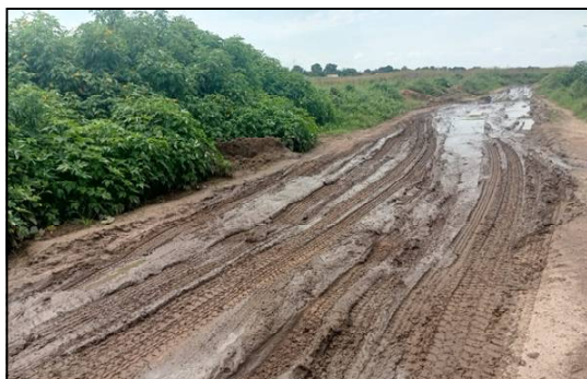
La route menant vers les quartiers Kabanza et SEP Congo (Kananga), en état de délabrement très avancé.

Les riverains attribuent en partie cette dégradation à l'absence de finition des