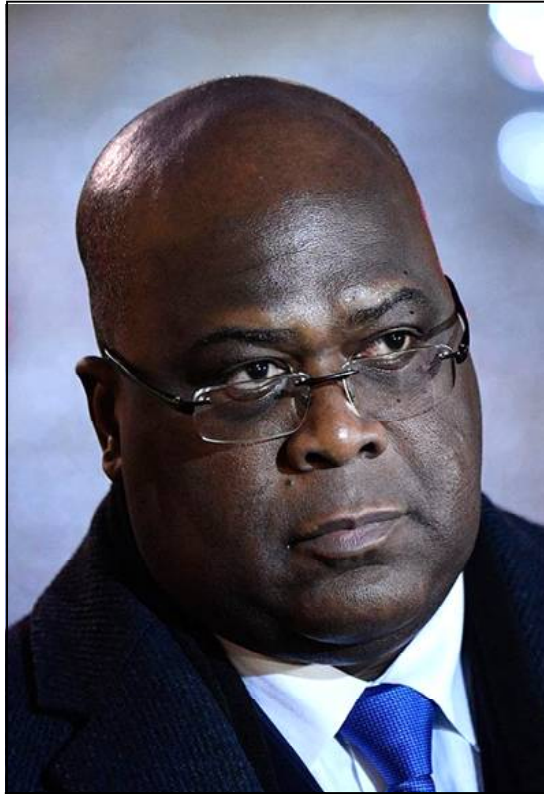
Félix Tshisekedi dans le collimateur de l'Opposition.

Le premier à dégainer a été Delly Sesanga. Dans une réaction rapide et structurée, le président d'Envol accuse le chef de l'Etat d'avoir