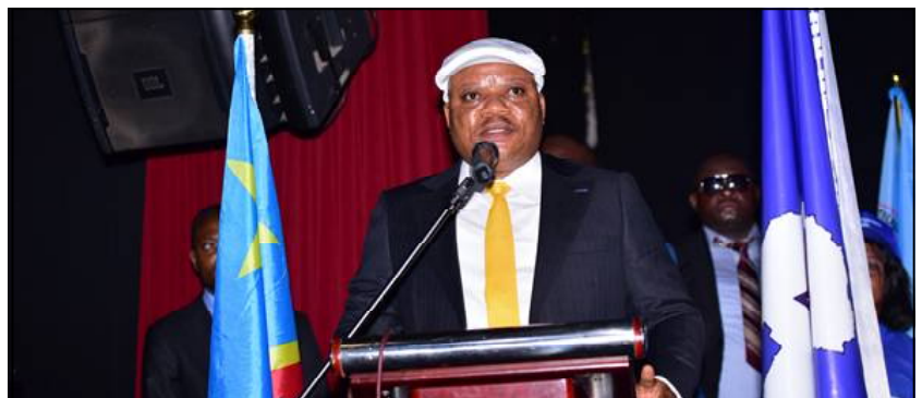
Jean-Marc Kabund.

L'opposant politique estime que le pays s'enfonce progressivement dans une