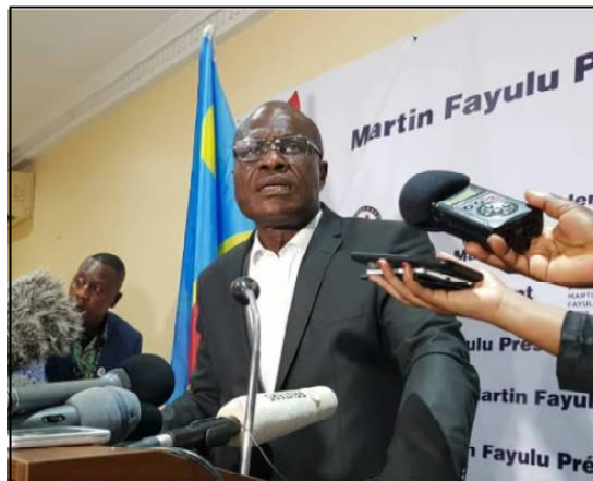
L'adresse de l'opposant Martin Fayulu sur la révision de la Constitution est attendue aujourd'hui.

Plusieurs sujets d'actualité seront abordés au cours de cet échange avec les professionnels des médias. Parmi les points très attendus, l'opposant congolais devrait préciser davantage sa position sur la révision constitutionnelle, indique son entourage.