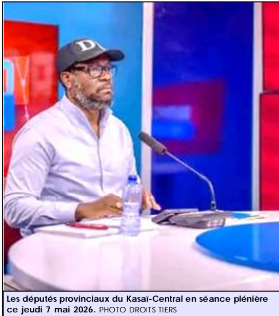
Les députés provinciaux du Kasai-Central en séance plénière ce jeudi 7 mai 2026.

"Félix Tshisekedi n'est ni homme d'Etat ni homme