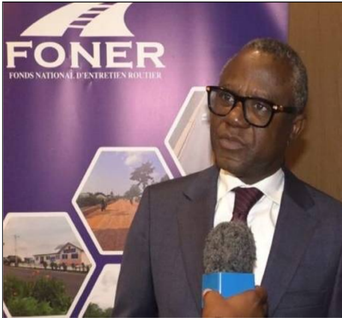
La dynamique imprimée par le DG Bundoki fait bouger les lignes.

Parallèlement, la gouvernance interne a été revisitée. La direction financière a été redynamisée avec l'opérationnalisation du service du budget, tandis que des outils modernes de gestion des ressources humaines, d'évaluation des performances et de formation continue ont été introduits. L'audit interne, renforcé, garantit désormais une meilleure fiabilité du système