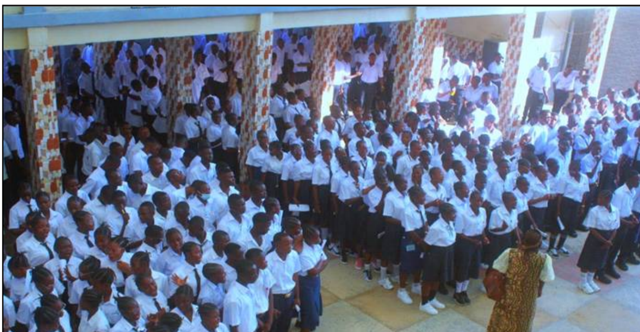
Des élèves finalistes au lancement officiel des épreuves hors-session à Kananga, au complexe scolaire Paulin de l'éternel.

Dans les territoires, les statistiques se présentent de la manière suivante : Demba compte 15 centres pour 5 277 candidats, dont 1 444 filles ; Dibaya dispose de 16 centres avec 4 790