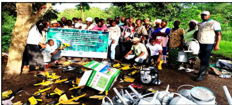
Des maraichers de Lususa et l'équipe du Cidoc posant devant le matériel agricole.