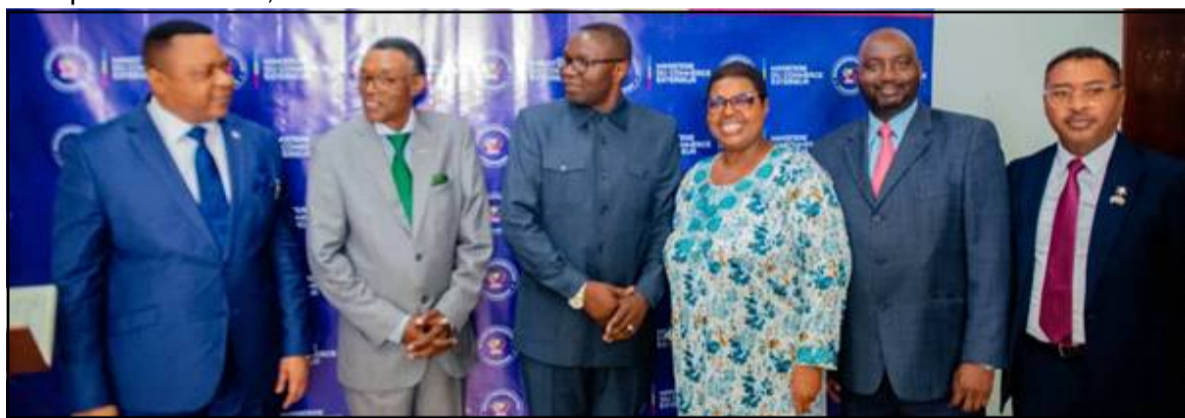
Photo de famille des délégations congolaises et Sud-africaines engagées dans le partenariat FPI-IDC.

délégation est venue consolider le processus de coopération bilatérale amorcé récemment à Kinshasa et relayé lors de la signature du mémorandum d'entente entre