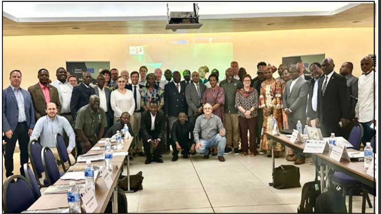
La photo de famille des participants à la rencontre.

M. Fabrice Basile a, en outre, évoqué les atouts économiques de cette initiative de Couloir vert Kivu-Kinshasa, qui réunit toutes les conditions d'un instrument