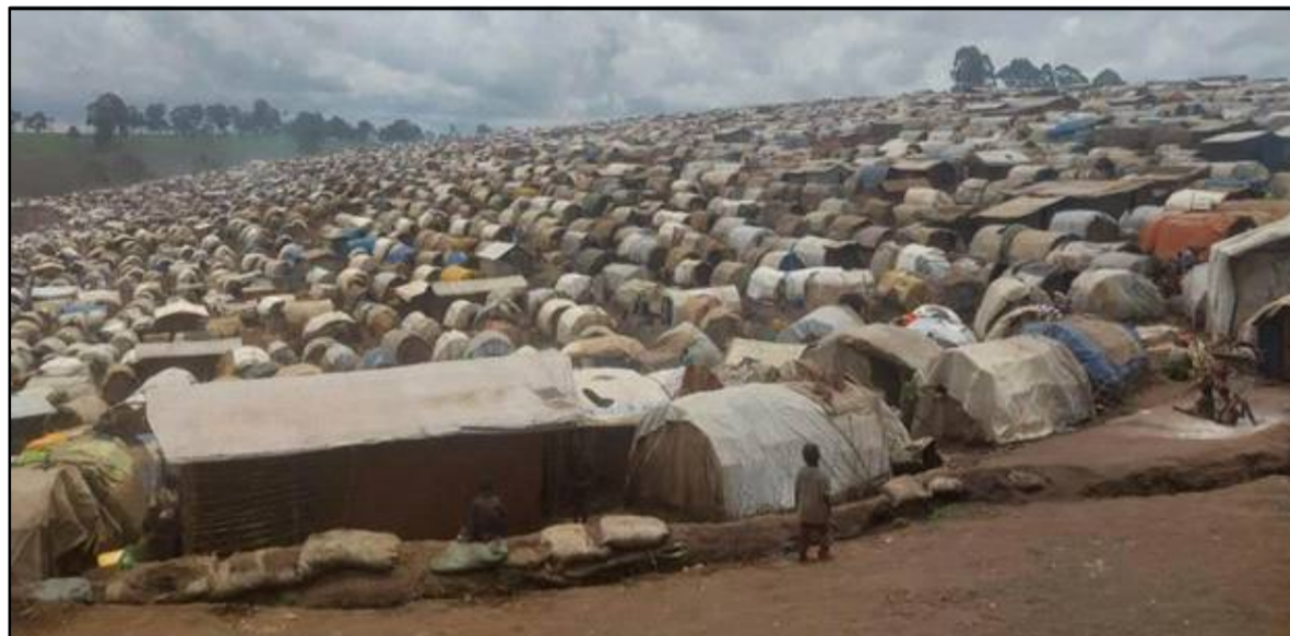
Une vue de camp de réfugié.

" MSF continue d'assurer des soins d'urgence, mais l'ampleur de la crise dépasse nos capacités. Sans une réponse rapide dans les secteurs de la santé, de la sécurité alimentaire et de l'eau, l'hygiène et l'assainissement, la protection et sans un accès sécurisé aux populations, la