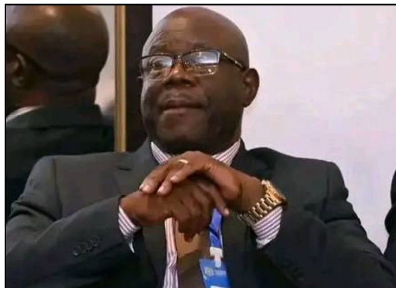
Le nouveau président de la Linafoot, Timothée Menayame

C'est la fumée blanche au niveau de la Linafoot. Il y a un nouveau dirigeant à la tête de cette grande structure du football national congolais. Ce, après pratiquement huit ans de règne de Jean-Bosco