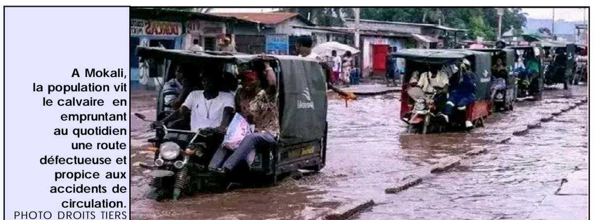
A Mokali, la population vit le calvaire en empruntant au quotidien une route défectueuse et propice aux accidents de circulation.

La route Mokali est symptomatique de la crise des infrastructures routières